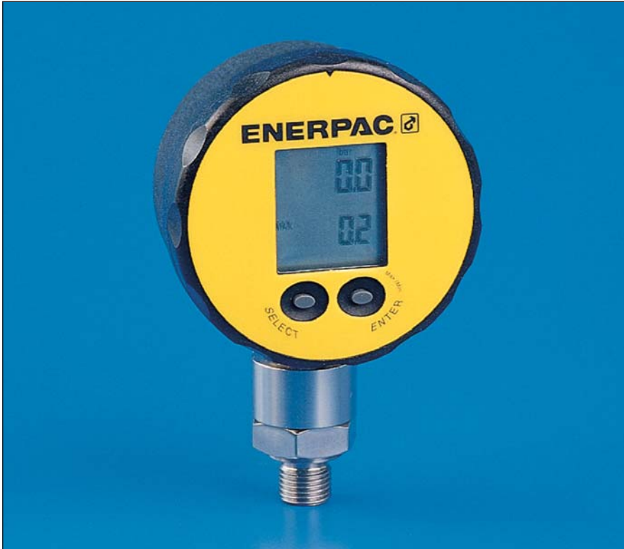
▼ 图示为: DGR-1